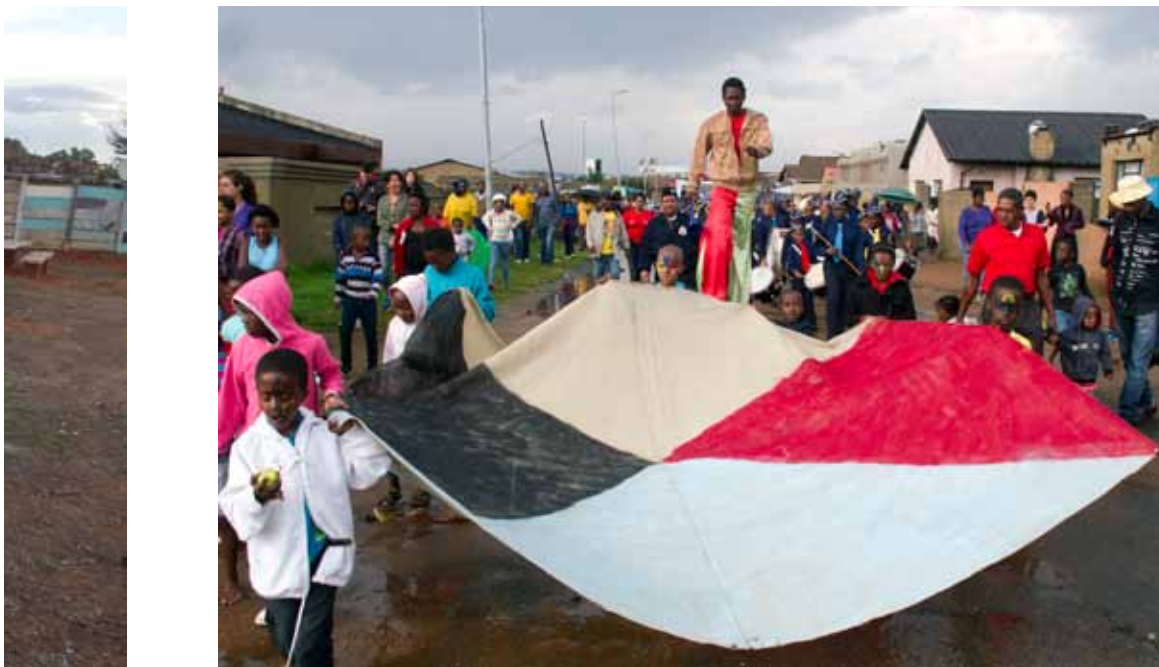
Skupnost temnopoltih Južnoafričanov je bila v času apartheida iz javnega prostora izključena, projekt Soweto pa je, tudi s festivalom ulice, pokazal, da si vključitve vanj želi.

če bi mesto Ljubljana pred sajenjem sadnih dreves poskrbelo za dialog s prebivalci, do vandalizma ne bi prišlo. Mesto mora javni prostor ustvarjati skupaj s prebivalci. To je tudi modrost participatornih projektov: ne delaš za skupnost, temveč skupaj s skupnostjo. Zgolj tako lahko uresničiš idejo mesta, ki resnično deluje.