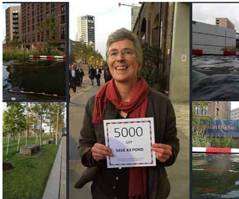
Skupaj z Ooze Architects je v pretižnem delu Londona King' Cross oblikovala javni umetniški projekt O prsti in vodi je plavalni bazen, ki so ga čistile vodne rastline. Ko se je po dveh letih bližal čas zaprtja, so uporabniki sami organizirali peticijo za trajno ohranitev bazena.

► Gre za to, da vstopiš v dialog z naravo, da narave več ne obravnavaš kot objekt, temveč kot subjekt. Če v ustavi piše »pravica do vode«, to pomeni, da še vedno vidimo