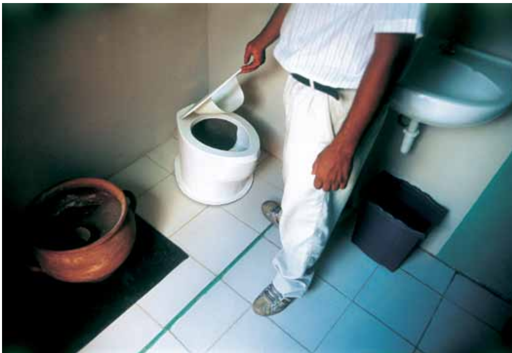
Danes takšna stranišča stojijo tudi v formalnem delu Caracasa in projekt živi svoje življenje.

prostore: gre za prostore, ki jih država danes nujno potrebuje, po eni strani zaradi upada socialne države, po drugi pa zaradi podnebnih sprememb. Vse to nas spodbuja, da o javnem prostoru razmišljamo na nov način. Ko oblikujemo javni prostor, oblikujemo javno mnenje. Hkrati so prostori, v katerih delam, tudi eksperimentalni: so kot laboratoriji, v katerih preizkušam različne ideje in kjer se artikulirajo nove izkušnje. Ti laboratoriji so prostori novih družbenih dogovorov. To je nekaj drugega kot privatiziran javni prostor ali javni prostor, ki se pretvarja, da je dostopen za vse, pa pravzaprav ni.